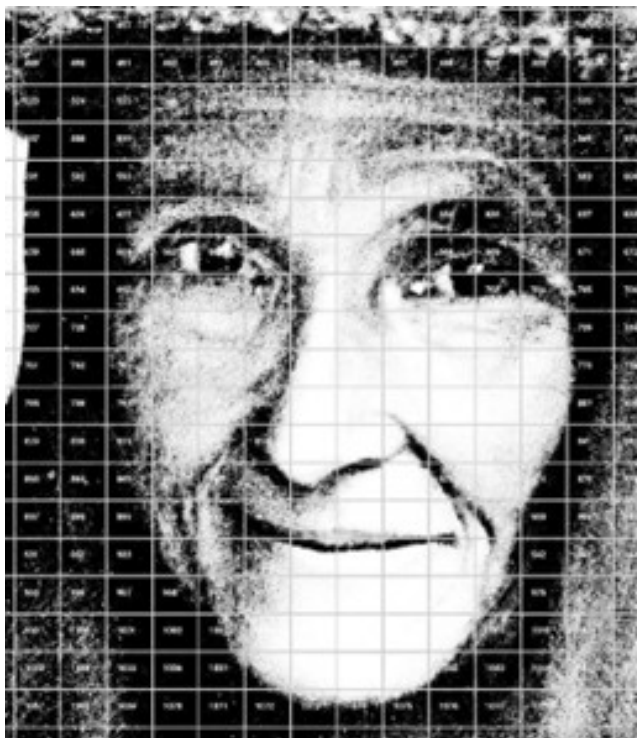
Figura 2: Detalle de la cuadrícula numerada con la que se compartimentó la imagen de Mujer de Ávila.

El mural se realizó sobre 1.972 fichas magnéticas en blanco, organizadas en 58 filas y 34 columnas. Cada alumno recibió cuatro fichas, junto con una reproducción impresa del fragmento correspondiente de la obra. Además se proporcionaron reproducciones completas cuadrículadas, con el fin de facilitar la apreciación simultánea de los detalles y de la perspectiva global de la pieza (Figura 2).