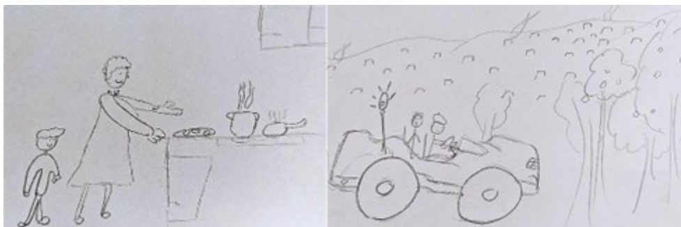
Figura 5: Dibujos realizados por uno de los participantes. En el dibujo de la izquierda, se aprecia al chico con su abuela realizando actividades de cocina. En el dibujo de la derecha, monta en un tractor en compañía de su abuelo. Foto: Área Educativa del Museo Universidad de Navarra. Cuadernillo ESO3-27.