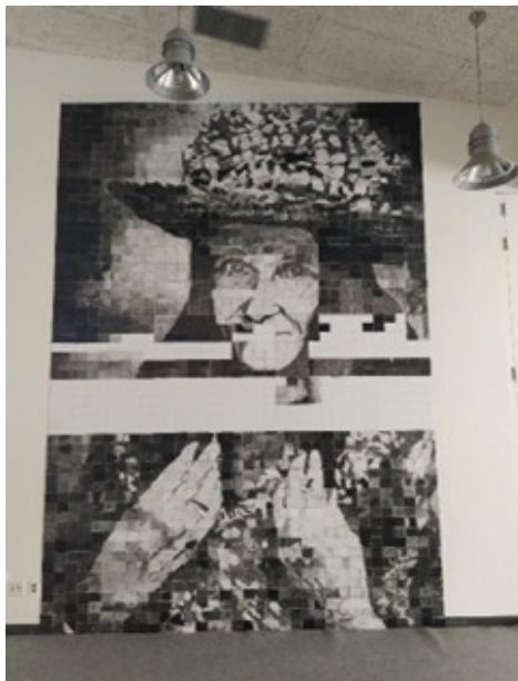
Figura 3: Vista general del mural colaborativo casi completado.